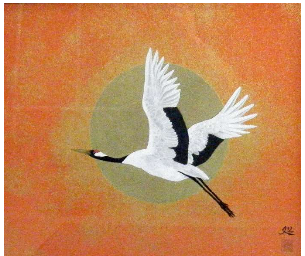
飛翔 #64 1981年 木版 画寸 46x53