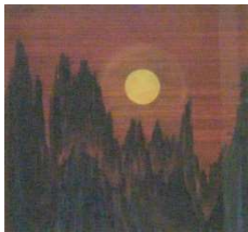
黄山 #95 1987年 メゾチント 画寸 18.6x19.7