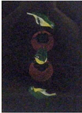
三羽の小鳥 (めじろ) #126 1992年 メゾチント 画寸 32.4x22.2