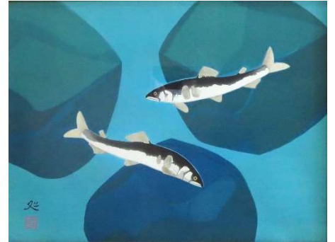
游 #98 1987年 木版 画寸 30x40