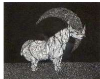
サイ #45 1978年 銅版 画寸 11.9x15