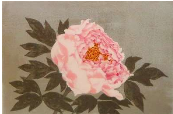
牡丹 #99 1987年 リトグラフ 画寸 20x30