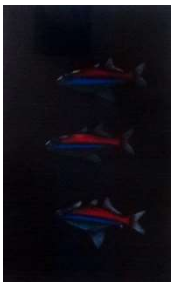
テトラ #105 1989年 メゾチント 画寸 24.5x14.5