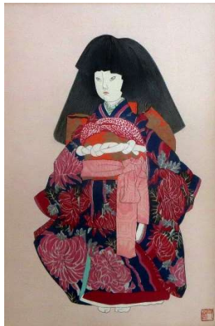
日本人形 #111 1990年 木版 画寸 40.8x26.8