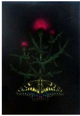
薊 #138 1996年 メゾチント 画寸 32.5x22.3