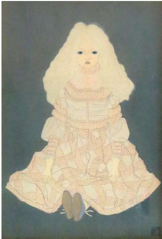
西洋人形 #110 1960年 木版 画寸