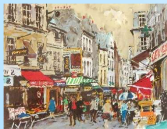
サンジェルマンのマルシェ 画寸 32.5x42