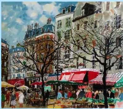
サンメダールの広場 画寸 45.5x53