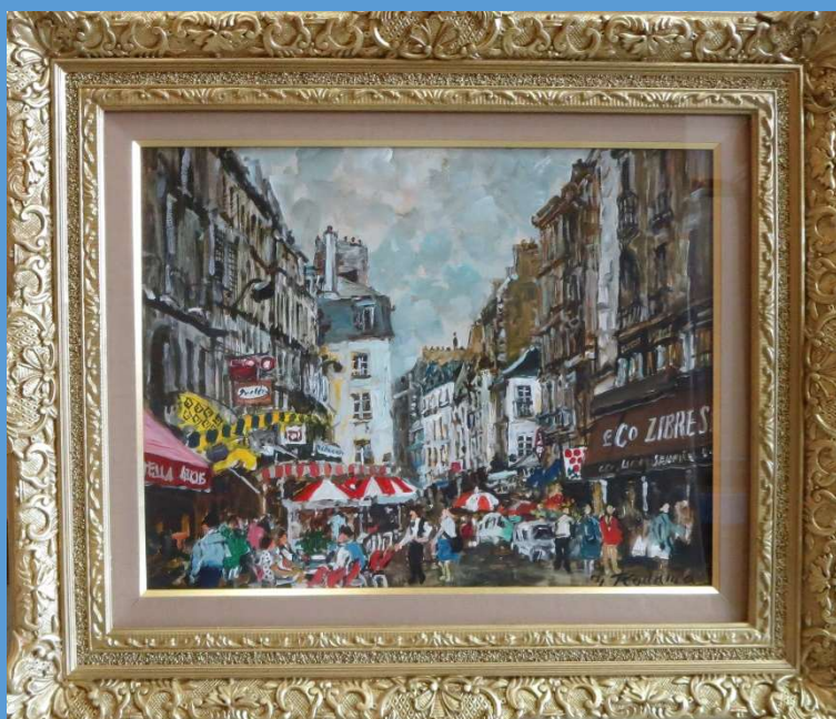
ラ・ド・セーヌ 油彩6号