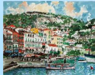
南仏の海岸 画寸 32.5x41