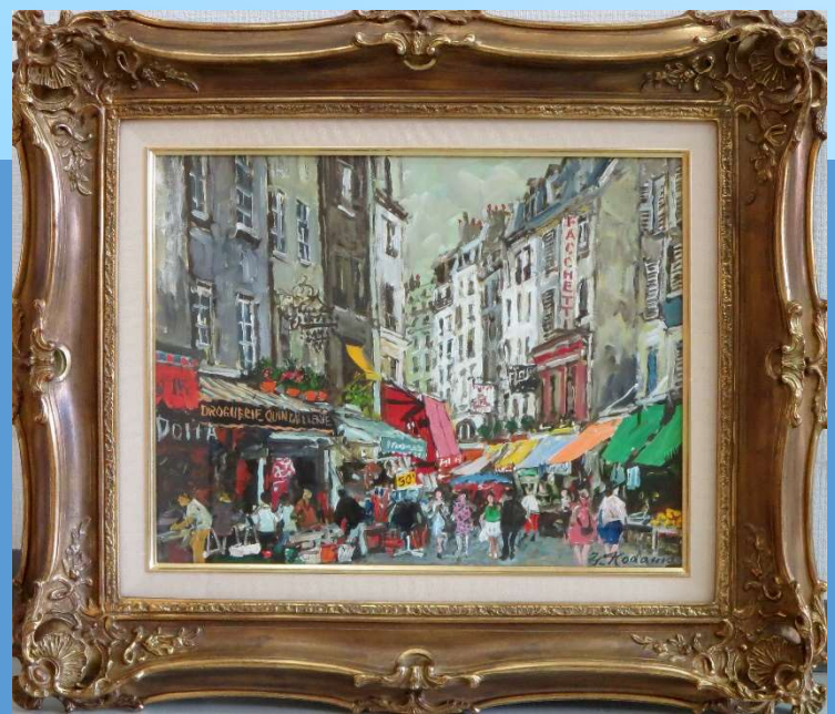
パリの朝市 油彩6号

1916年 大阪の薬屋に生れる。 1934年 関西学院大経済学部に進学。 高村孝之介に師事。関西美術展入選。 1937年 二科展入選。 1947年 二紀会創立に参加。 1992年 逝去。享年72才。