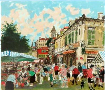
ニースの花市 画寸 45x53