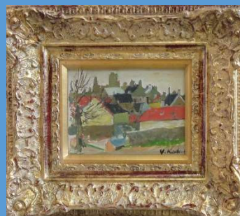
風景シャトル 油彩1号