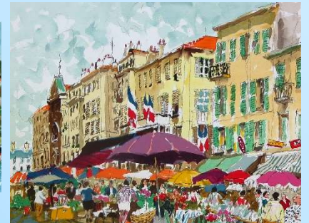
初夏のマルシェ 画寸 31.5x41