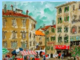
日曜日の午後 画寸 25x33