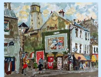
パリ街角 画寸 32.5x41